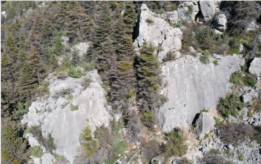
(Nicolas Bianchi - Parc national des Ecrins)