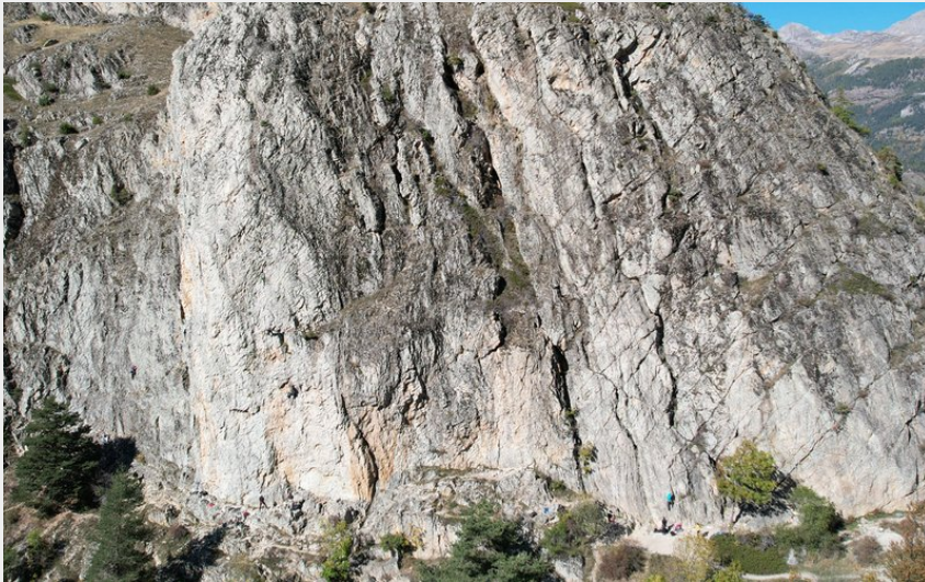
(Nicolas Bianchi - Parc national des Ecrins)