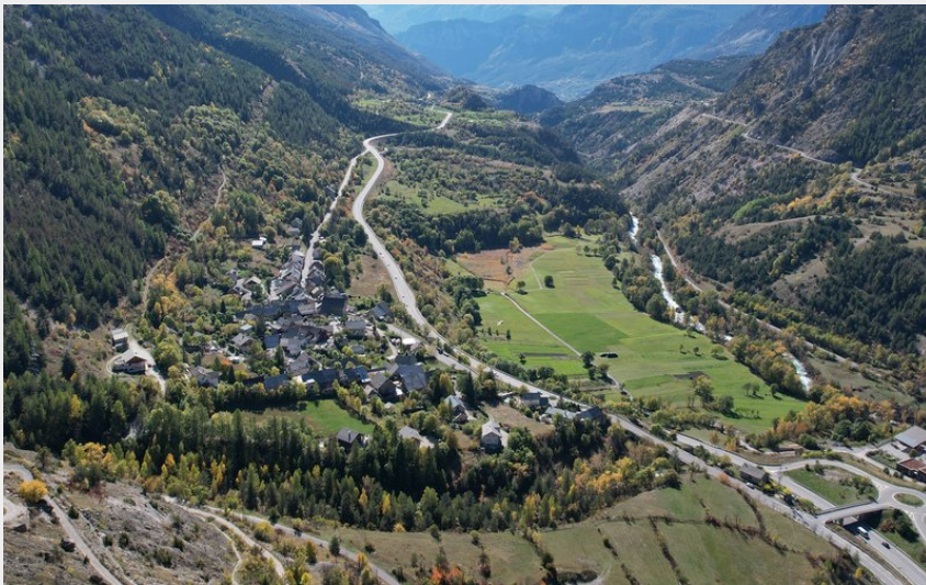
(Nicolas Bianchi - Parc national des Ecrins)