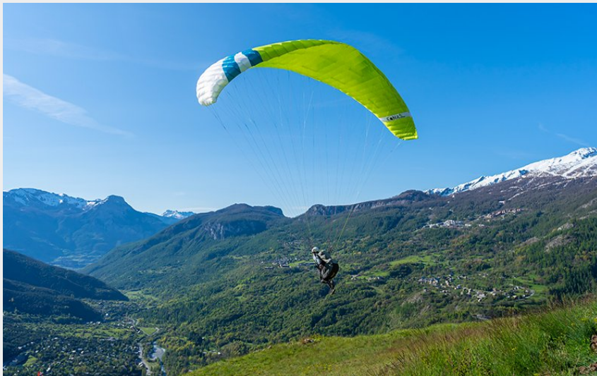
Puy-Aillaud - Site de décollage (Rogier Van Rijn)