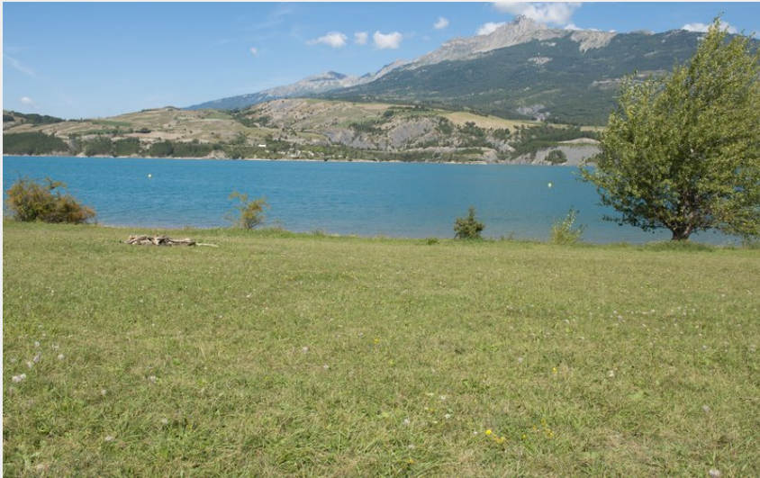
vue sur les aiguilles de Chabrières