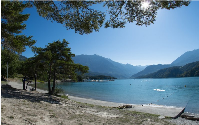
Port Saint Pierre (Le Naturographe)