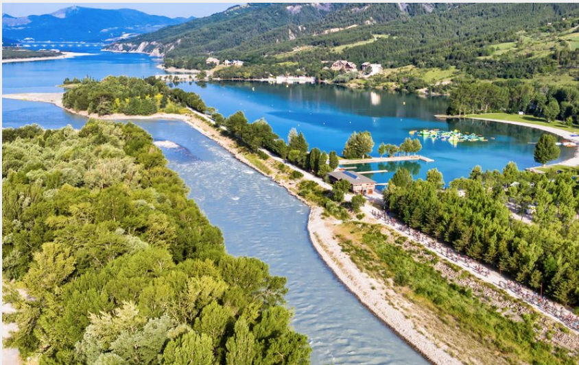
Durance, plan d'eau d'Embrun et lac de Serre-Ponçon