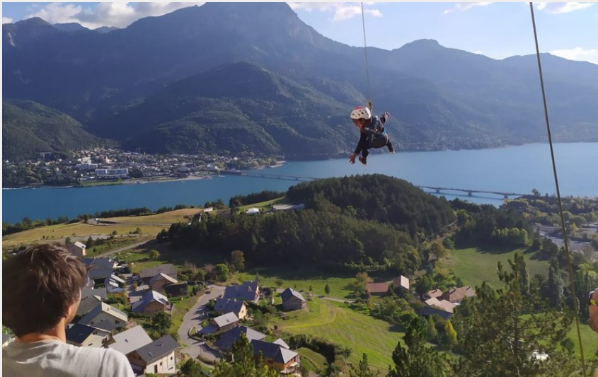
Vue sur le lac de Serre-Ponçon depuis le site d'escalade