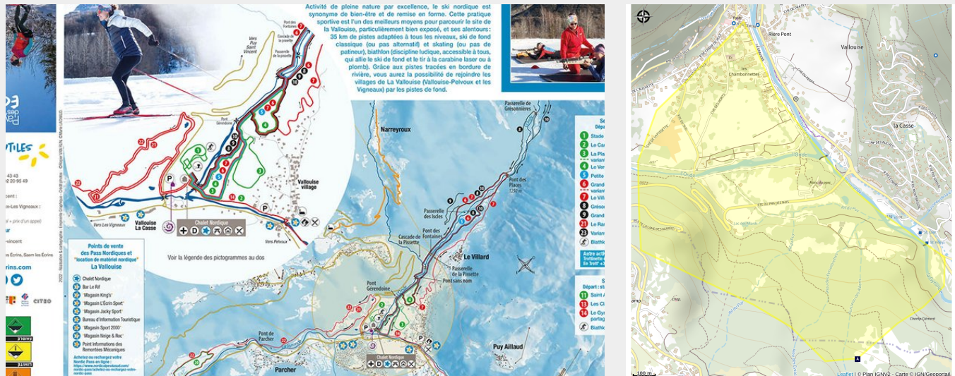
Plan domaine nordique de la Vallouise

Le secteur de La Plaine de Vallouise est idéal pour les enfants et les sorties en famille, ou pour s'initier à la pratique du ski de fond.