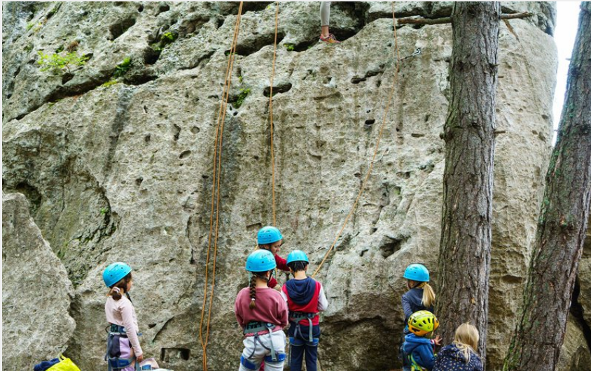
Rocher école (E.thomas)