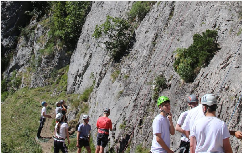
Falaise des Orres