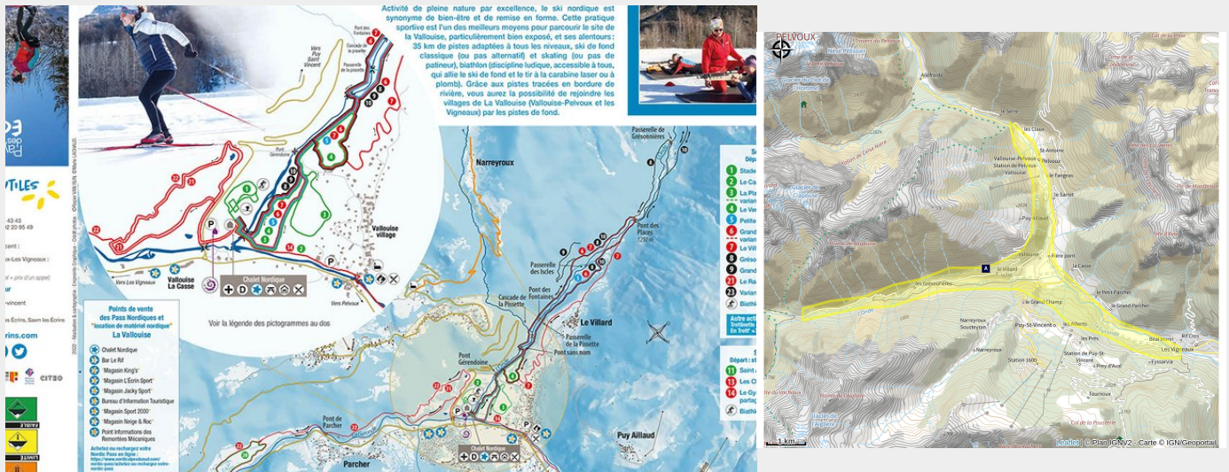
Plan ski de fond la Vallouise

Le domaine nordique de Vallouise peut être divisé en quatre secteurs : le secteur de La Vallouise , de L'Onde , de Pelvoux et des Vigneaux .