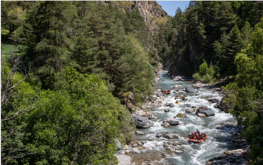
Sortie de la combe de Château-Queyras