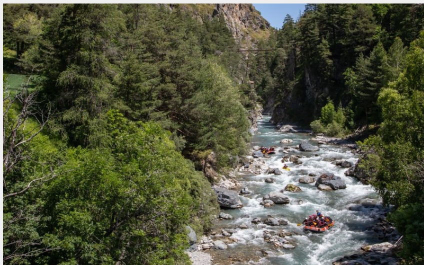
Sortie de la combe de Château-Queyras