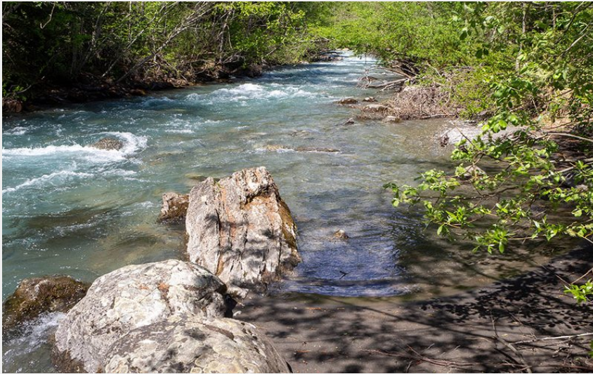
Biasse P2 Embarquement (Claude Margaux)