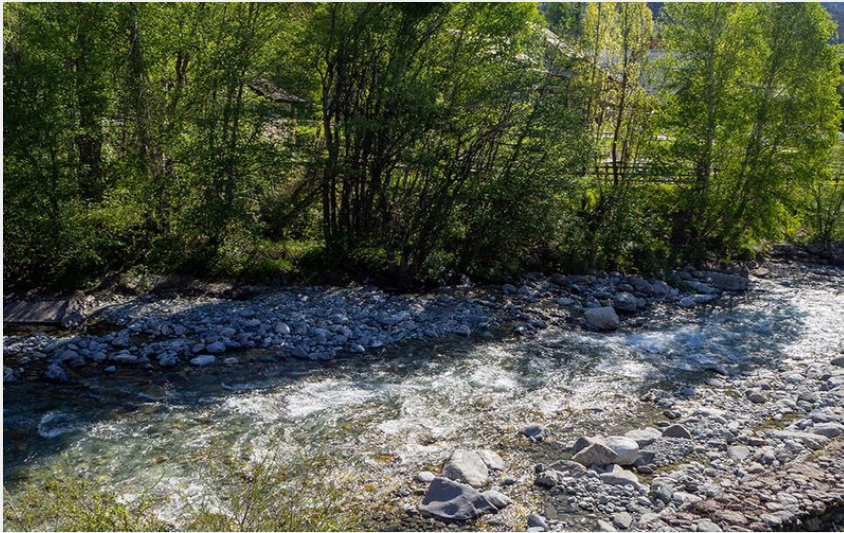
Gyrone P1 Embarquement (Claude Margaux)