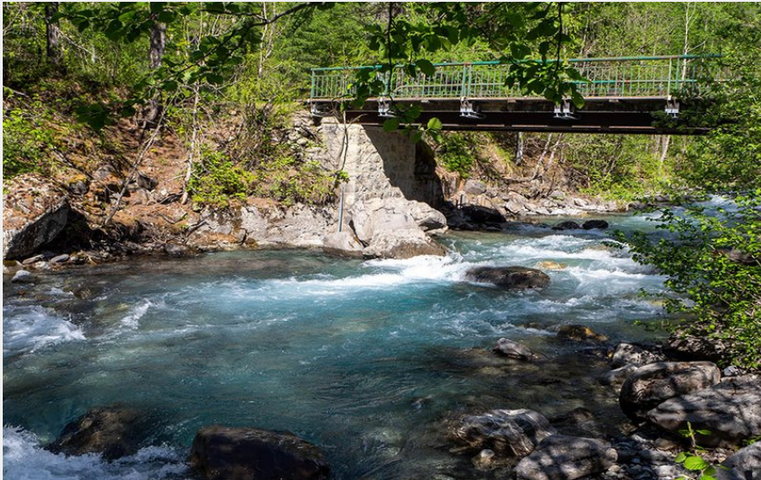
Embarquement Onde 1 (Claude Margaux)