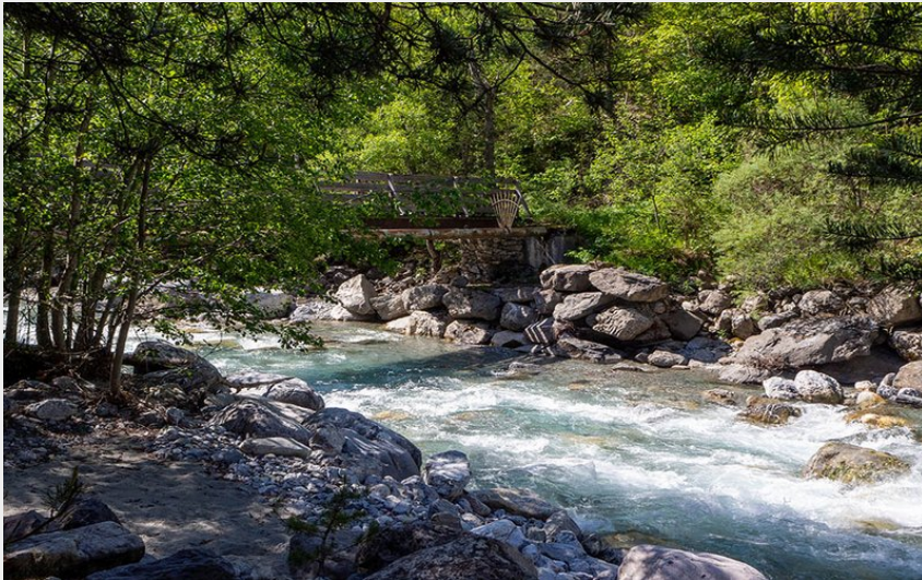
Gyrone P2 Embarquement (Claude Margaux)