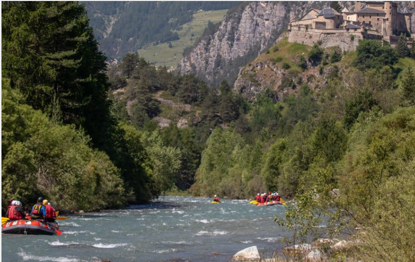
A l'approche de Château-Queyras