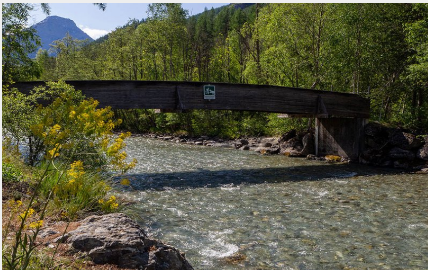
Gyrone P1 Débarquement (Claude Margaux)