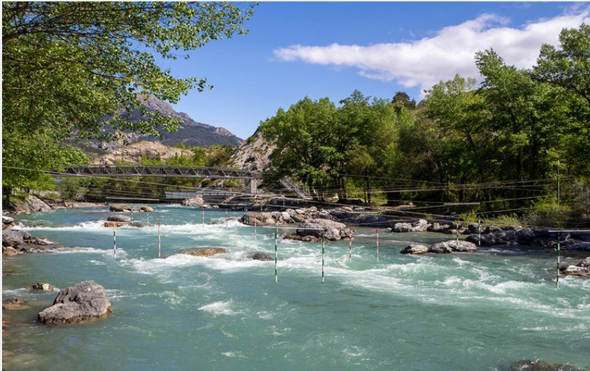
Gyrone P2 Débarquement 1 (Claude Margaux)