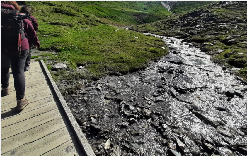
Paysage du col Agnel (Stephanie_CACHINERO)