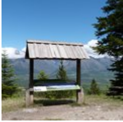
Table d'orientation et aire de pique nique (F)

Au bout du sentier botanique Dominique Villars, prenez le temps de faire une pause à la table d'orientation du Noyer en Champsaur. Très beau point de vue panoramique sur le Champsaur et ses sommets. Table de pique-nique à disposition.