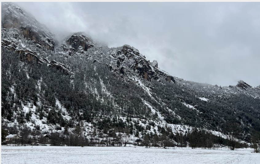
Plaine de Freissinières (Pierre Nossereau)