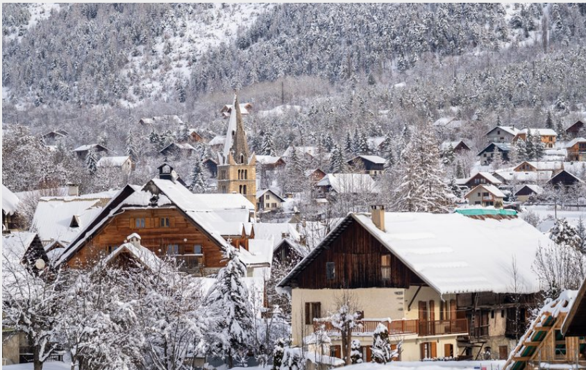
Vallouise sous la neige (Rogier van Rijn)