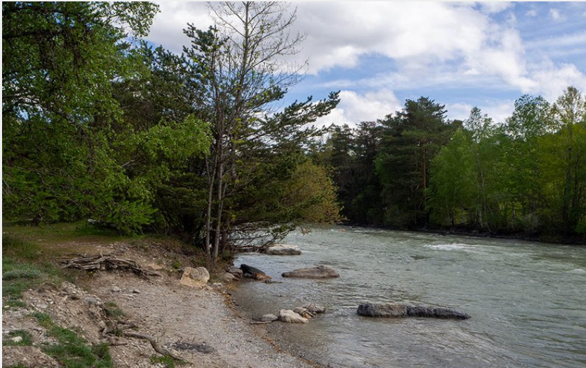
Durance P3 Débarquement (Claude Margaux)