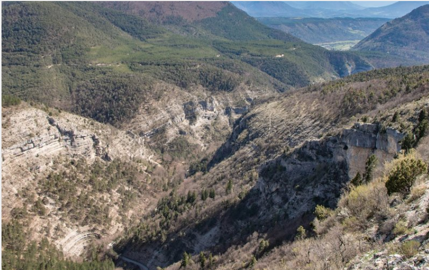
Vue panoramique sur les gorges d'Agnielles (Damien Desbenoit)