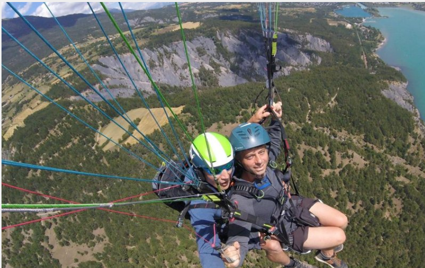
Survol des terres noires (Bernard Keller)