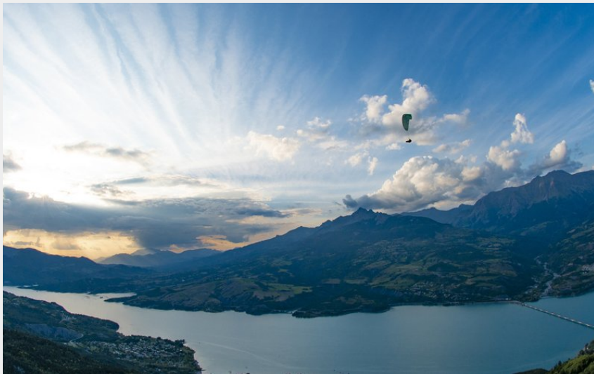
Parapentiste depuis Pierre Arnoux (LeNaturgraphe)