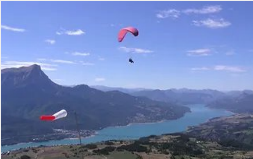
Décollage du Mont Guillaume (Bernard Keller)