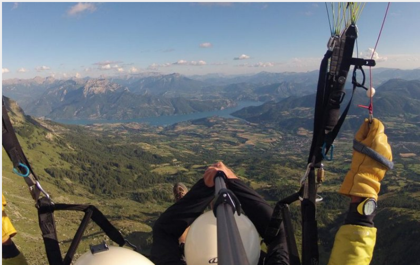
Biplace au dessus de la montagne de Chorges (Mairie de Chorges)