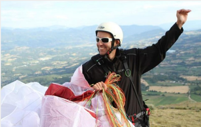
Les dernières préparations avant le décollage (Mairie de Chorges)