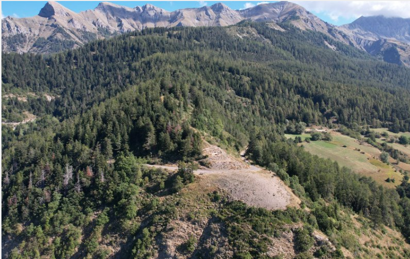
Décollage de La Bâtie-Neuve (CCSPVA)