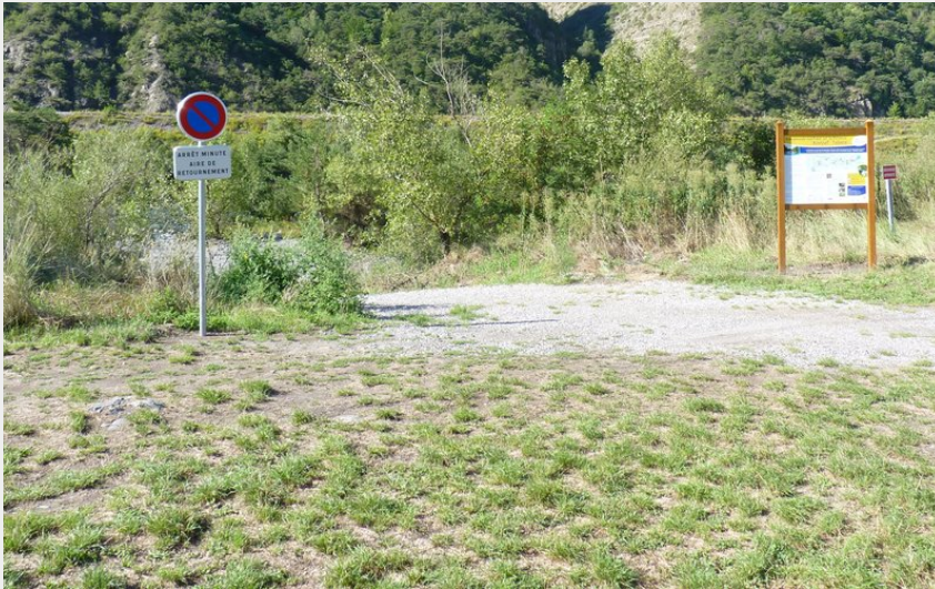
Mise à l'eau d'Espinasses (CCSPVA)