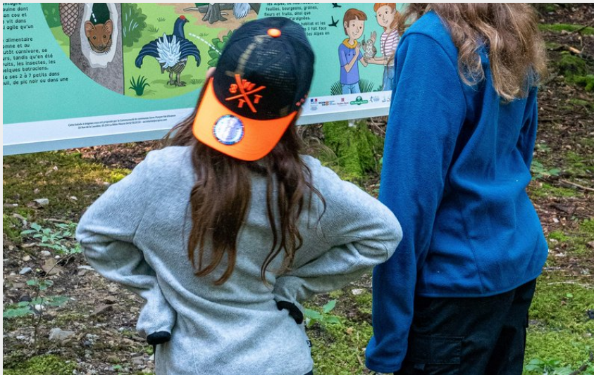
Balade à Enigmes (CCSPVA)