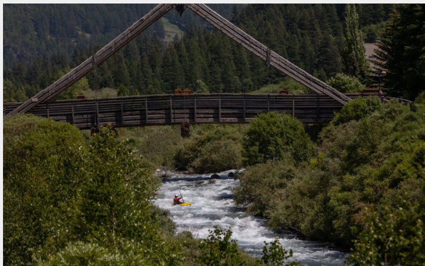
Sous le pont en bois de Ristolas