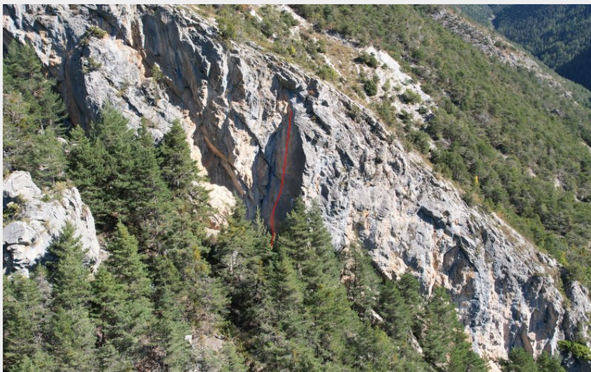
(Nicolas Bianchi - Parc national des Ecrins)