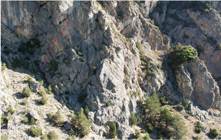
(Nicolas Bianchi - Parc national des Ecrins)