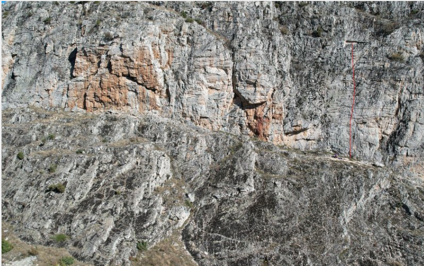
(Nicolas Bianchi - Parc national des Ecrins)