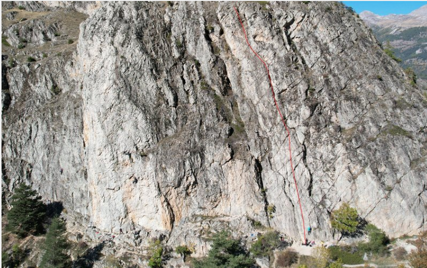
(Nicolas Bianchi - Parc national des Ecrins)