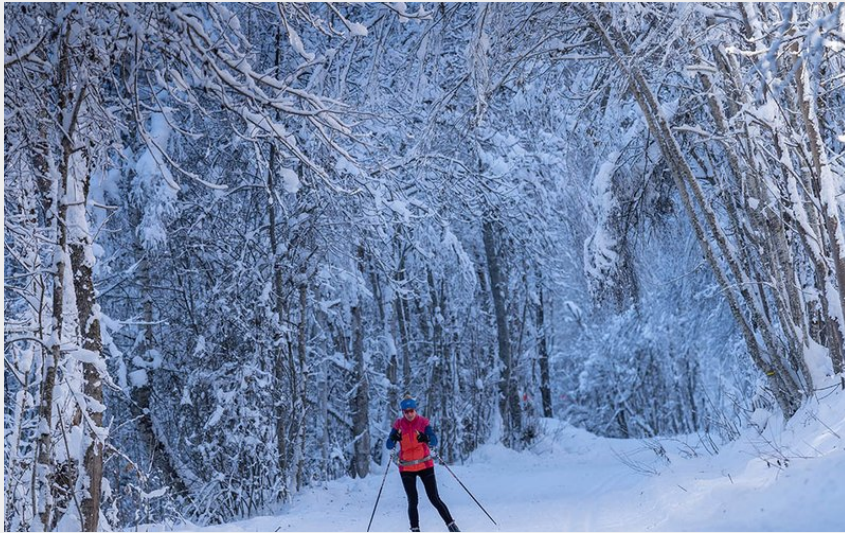
L'Onde (Rogier Van Rijn)