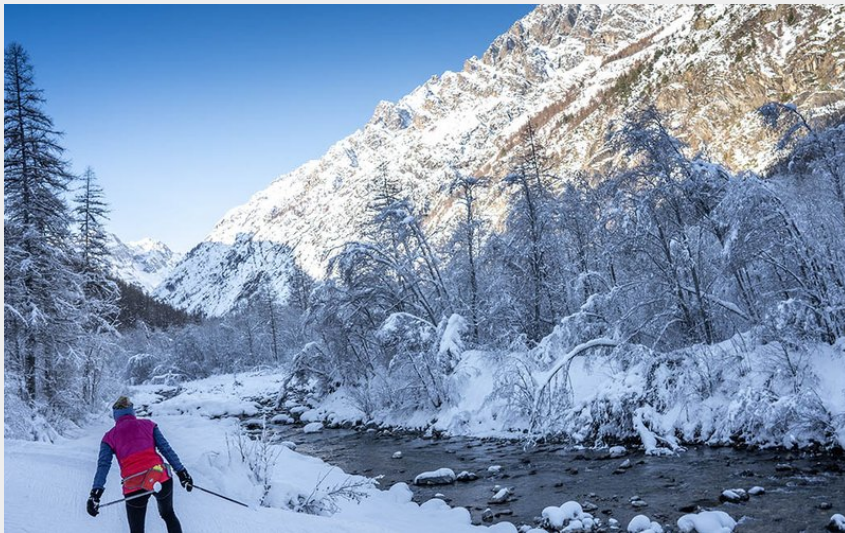
L'Onde (Rogier Van Rijn)