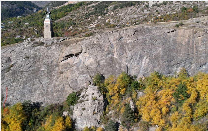
(Nicolas Bianchi - Parc national des Ecrins)