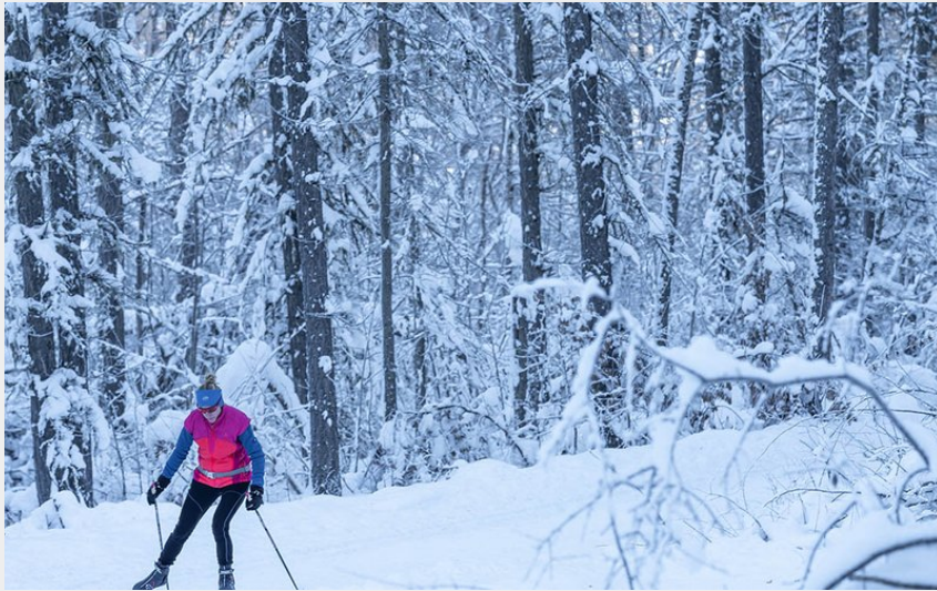
L'Onde (Rogier Van Rijn)