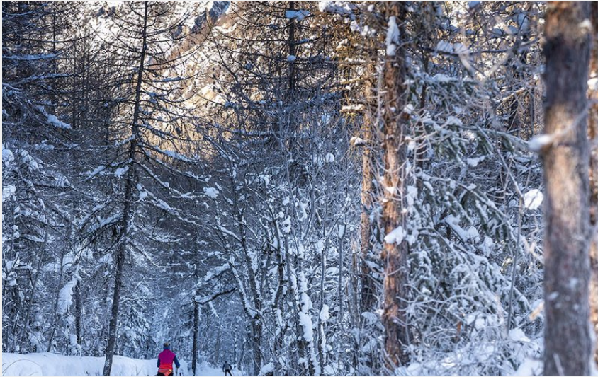
L'Onde (Rogier Van Rijn)