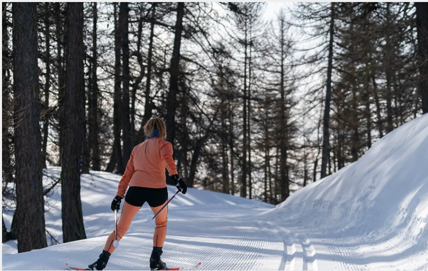
Piste n°4 : Les Grandes Têtes (Rogier Van Rijn)