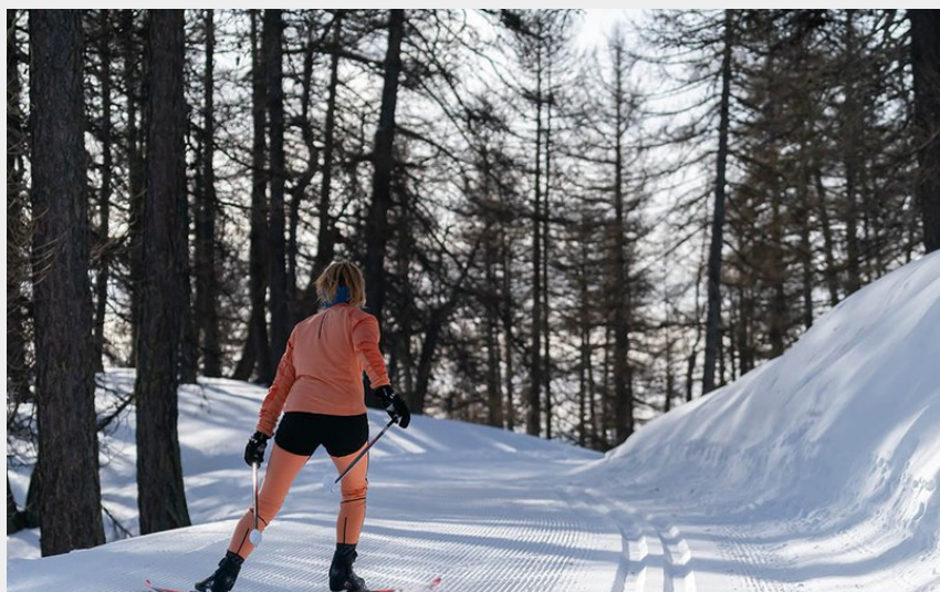
Piste n°4 : Les Grandes Têtes (Rogier Van Rijn)