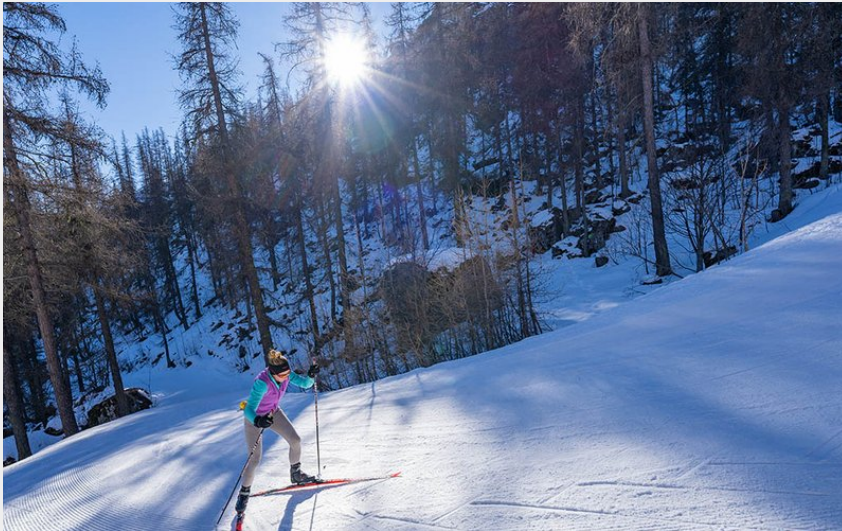
Piste n°3 : Les Têtes (Rogier Van Rijn)