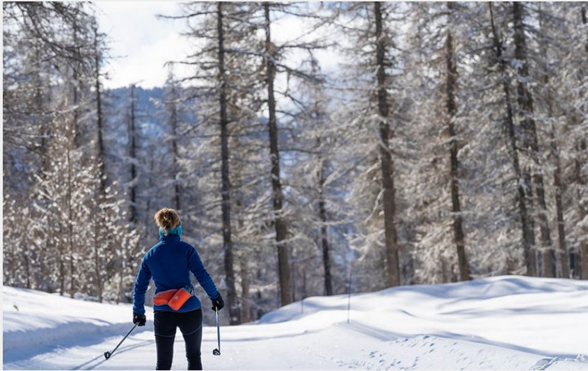
Piste n°2 : Tour de la Pousterle (Rogier Van Rijn)