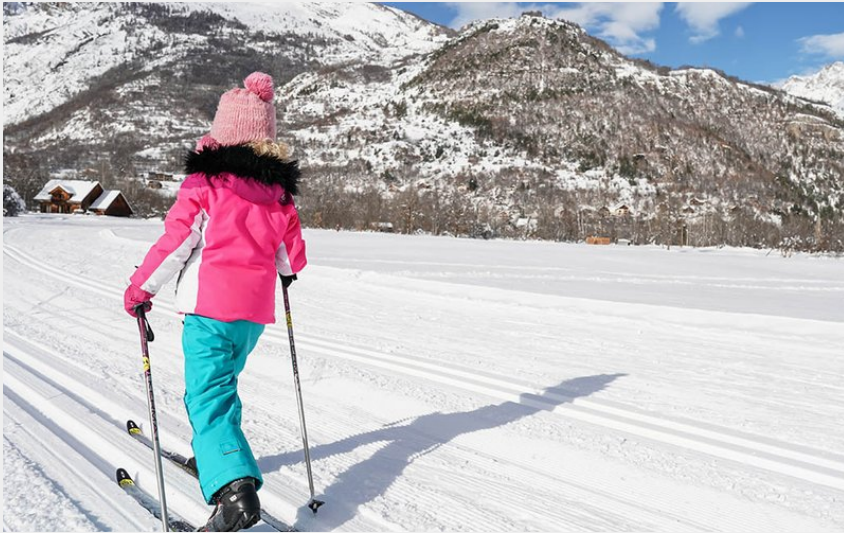
La Plaine de Vallouise (Rogier Van Rijn)