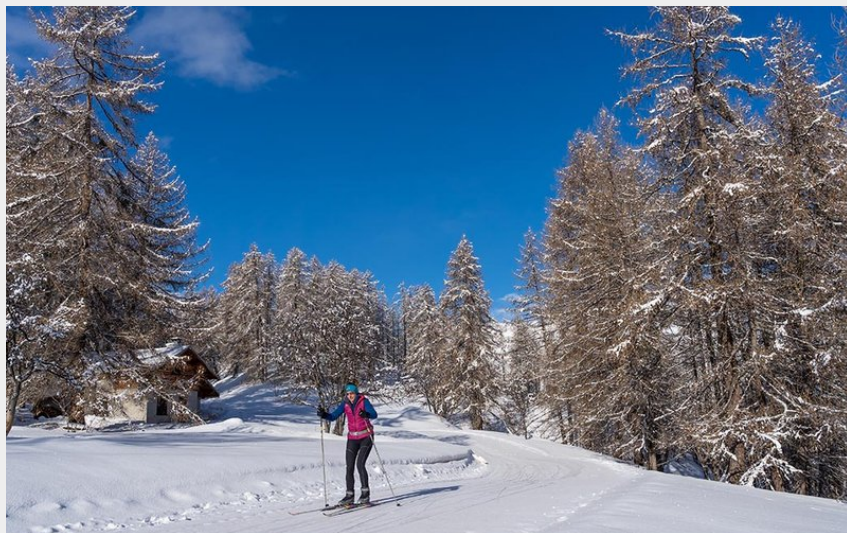
Piste n°1 : Tournoux - La Rochaille (Rogier Van Rijn)